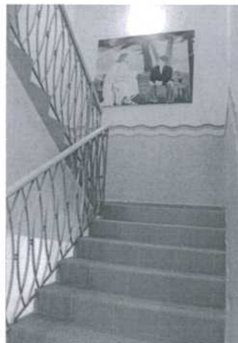
Neugestalteter, freundlicher Flur im Jungenwohnheim