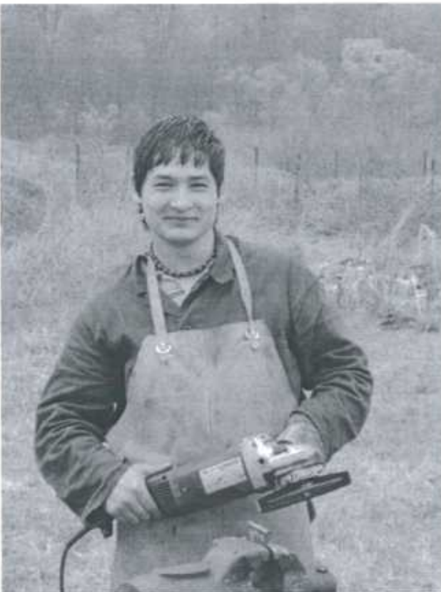
Auszubildender am Don Bosco Zentrum in Kazincbarcika/ Ungarn. In den Sommermonaten fanden zahlreiche Praxisübungen im Freien statt.

Die Salesianer möchten die benachteiligten Jugendlichen der Roma durch eine ganzheitliche Ausbildung und Betreuung in ihrer spirituellen, kulturellen, intellektuellen, physischen und emotiona-