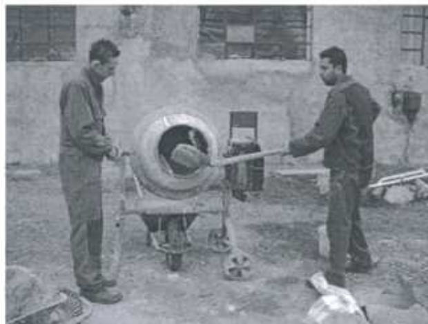
Auszubildende an der Don Bosco Berufsschule in Karzincbarcika/ Ungarn.