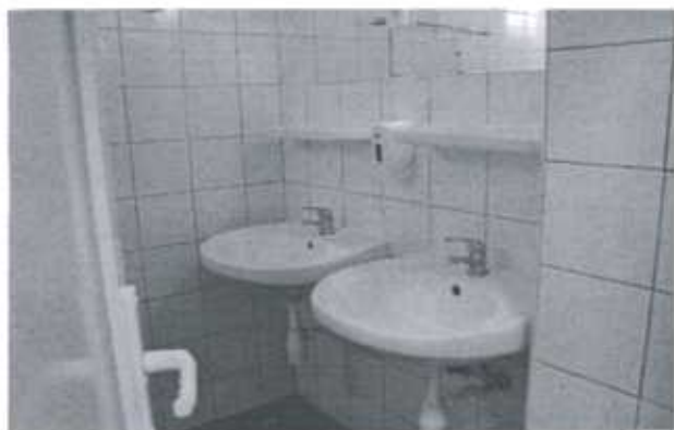
Kazincbarcika: Neue Sanitäranlagen im Lehrlingswohnheim

Die einst blühende Region sank langsam auf den Status des Armenhauses in Ungarn ab. Neben dem wirtschaftlichen Niedergang führt eine unzureichende, bisweilen ganz fehlende schulische und berufliche Bildung bei vielen Jugendlichen und jun-