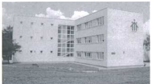
Die neuen Ausbildungsräume des Don Bosco Zentrums in Kazincbarcika wurden bereits im Jahr 2008 von der Stiftung unterstützt.

len Entwicklung fördern. Langfristiges Ziel ist es, ihnen wichtige berufliche sowie gesellschaftliche Qualifikationen mit auf den Weg zu geben, die ihnen den Start in das Arbeitsleben und die Integration in die Gesellschaft erleichtern. Durch die Renovierung des Jungenwohnheims möchte man den Jugendlichen eine angenehme Wohnatmosphäre zu ermöglichen und ihnen eine familienähnliche Umgebung schaffen, in der sie sich wohlfühlen. Dies schafft ein gutes Lernumfeld, was für die schulische und berufliche Ausbildung der Jugendlichen von großer Bedeutung ist.