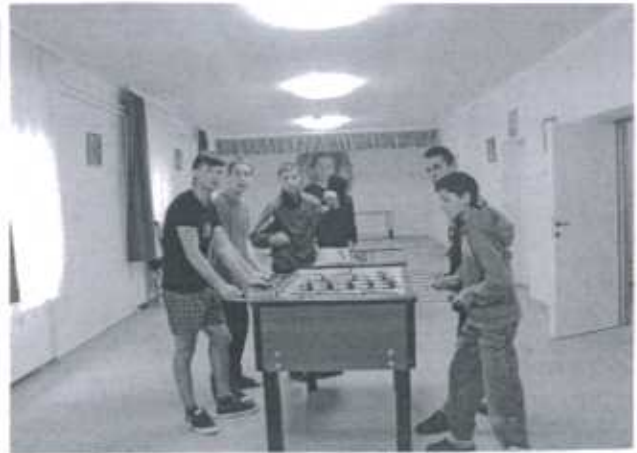
Nach der Renovierung des Jungenwohnheims können sich die Jungs auch über einen neuen Kickertisch freuen

Im Namen der gesamten Salesianer-Provinz Ungarns und besonders im Namen der Jugendlichen unserer Ausbildungseinrichtungen für Zigeunerjugendliche in Kazincbarcika möchte ich Ihnen ganz aufrichtig für Ihre großartige und großzügige Hilfe danken.