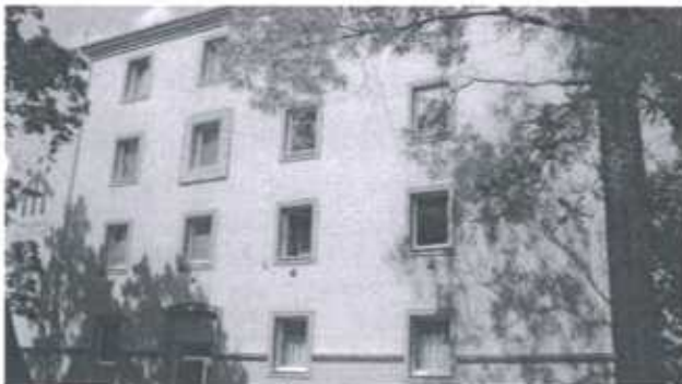
Kazincbarcika: Neue Aussenfassade des Wohnheims

Mit dem Ende des kommunistischen und zentral gesteuerten planwirtschaftlichen Systems in den Neunziger Jahren begann der Niedergang der Industrie. Dies zog massive soziale Probleme nach sich: 60% der Bewohner sind heute arbeitslos und beziehen Arbeitslosenhilfe. Ein wenig Unterstützung vom Staat in Höhe von 150-200 EUR monat-